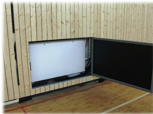
HK-Verteiler Wandheizung Sporthalle Hinter Prallwand