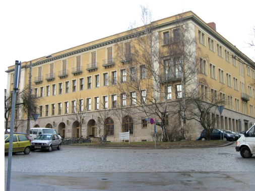
Max Wien Platz 1, 07745 Jena