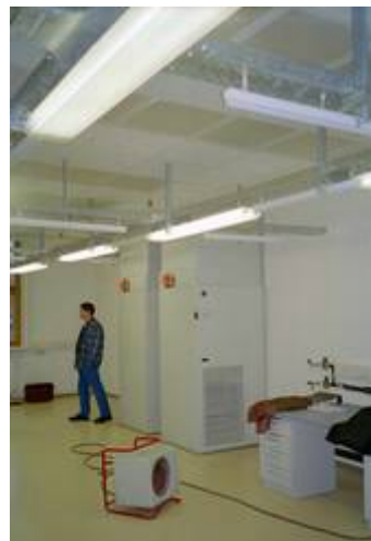
Hochleistung-Umluft-Kühlanlage im Laserlabor 1.OG